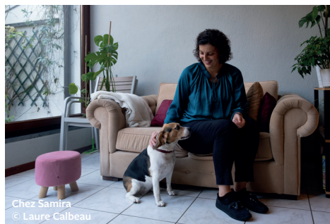
Chez Samira

La taille des salons limite le nombre de places. Dans le cas où vous réserveriez, merci d'honorer le rendez-vous pris afin de ne priver personne!