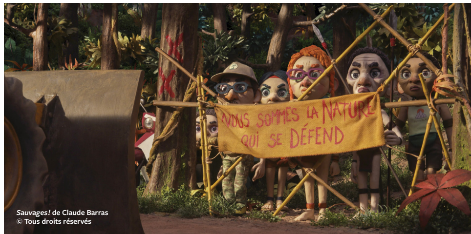
Sauvages! de Claude Barras