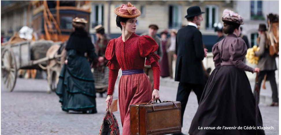
La venue de l'avenir de Cédric Klapisch

Depuis quelques années, le Centre Culturel Archipel 19 s'emploie à proposer une programmation cinéma éclectique et éclairée, se positionnant comme un véritable cinéma de quartier, propice aux découvertes et aux rencontres.