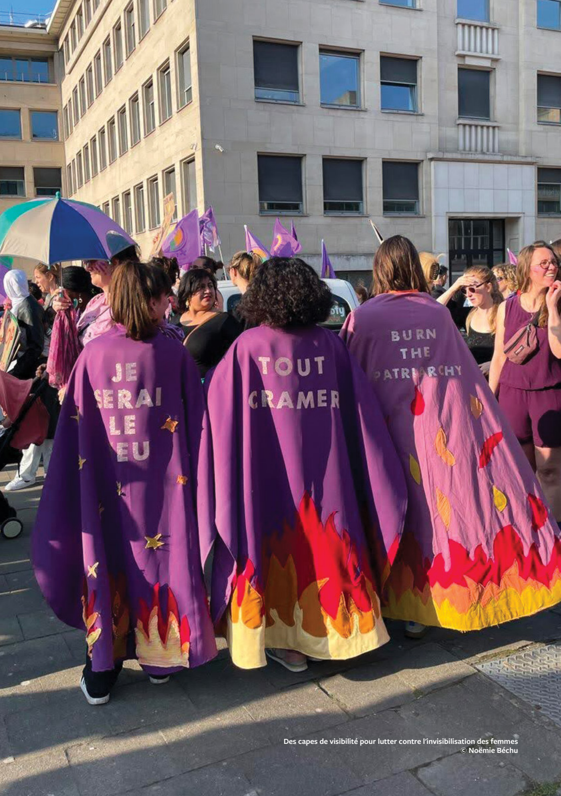
Des capes de visibilité pour lutter contre l'invisibilisation des femmes